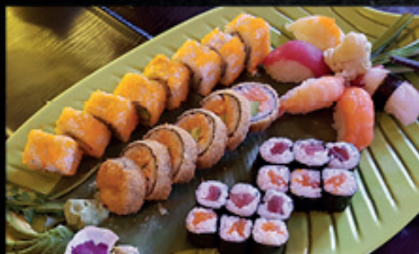
Menü 15 11,10 19,90

8 Inside - Out: 4 Alaska, 4 Cali 12 Maki: 3 Thunfisch, 3 Lachs, 6 Cali