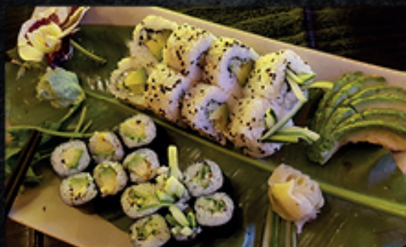
Menü 20 1 10,90

12 Maki: 6 Rucola, 6 Avocado 3 Nigiri: Tamago, Tofutasche, Avocado