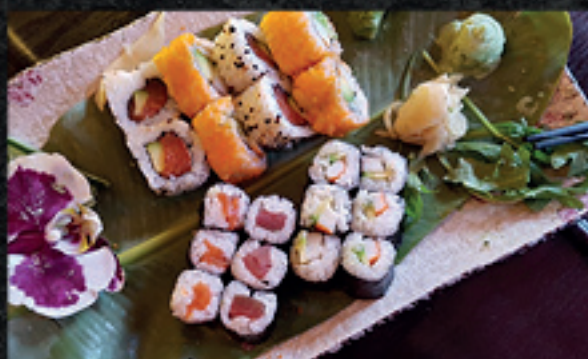
Menü 14 11 11,90

18 Maki: 6 Thunfisch, 6 Lachs, 6 Cali 6 Nigiri: 1 Lachs, 1 Thunfisch, 1 Butterfisch, 1 Tamago, 1 Tintenfisch, 1 Garnele 4 Inside - Out: 4 Cali 8 Tempura: 8 Lachs