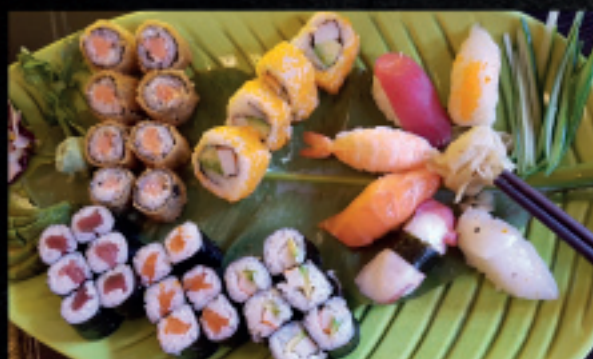
Menü 13 12,21 21,90

Alle Sushis werden mit Frischkäse zubereitet. Auf Wunsch auch ohne. Sushi's in den Menü's austauschbar gegen einen Aufpreis von 3,00€.