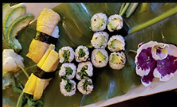
Menü 17 1 10,50

24 Inside - Out: 8 Tobiko Roll, 8 Alaska Roll, 8 Hawaii