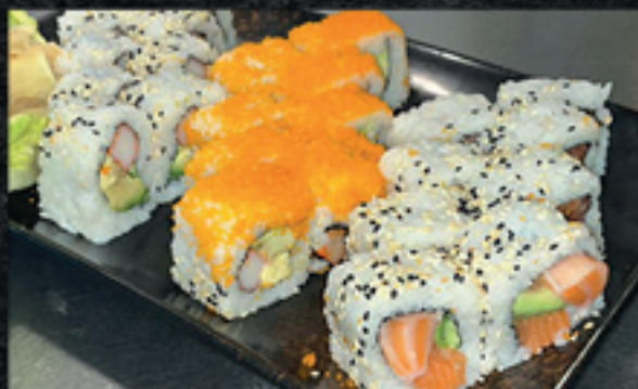
Menü 16 11 19,90

8 Inside - Out: 8 Cali 4 Tempura 12 Maki: 6 Lachs, 6 Thunfisch 5 Nigiri: 1 Lachs, 1 Tintenfisch, 1 Thunfisch, 1 Butterfisch, 1 Garnele